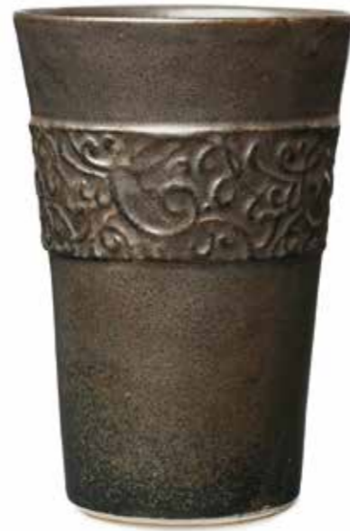
Ornamentbecher Ø 9 cm Höhe 13 cm Artikel Nr. 41 110