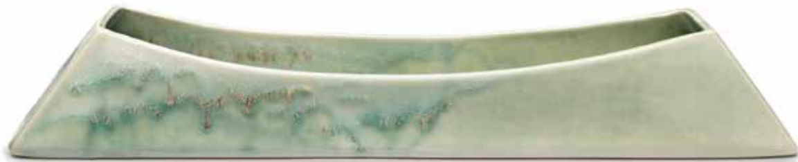
Schale »Floß« 44 x 10 x 7 cm Artikel Nr. 41 807