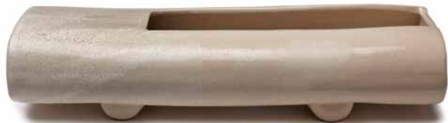
Schale »Bambus« 35 x 12 x 8,5 cm Artikel Nr. 41 878