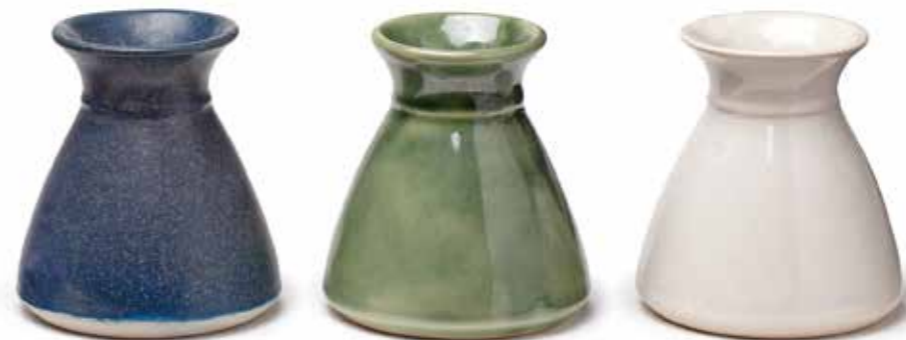
Die gewünschte Glasurfarbe geben Sie bitte anhand der Übersicht auf Seite 14 an.