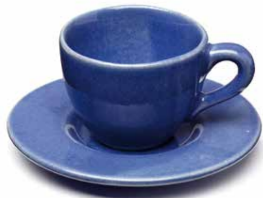
Espressotasse mit Untertasse Artikel Nr. 41 164