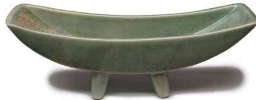
Gefäß »Mond« Ø 23 cm Breite: 8 cm Artikel Nr. 41 835