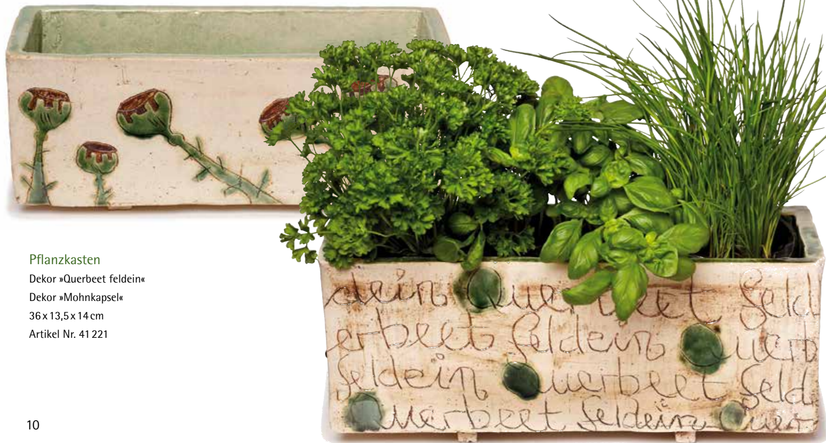
Pflanzkasten Dekor »Querbeet feldein« Dekor »Mohnkapseln« 36x13,5x14cm Artikel Nr. 41 221