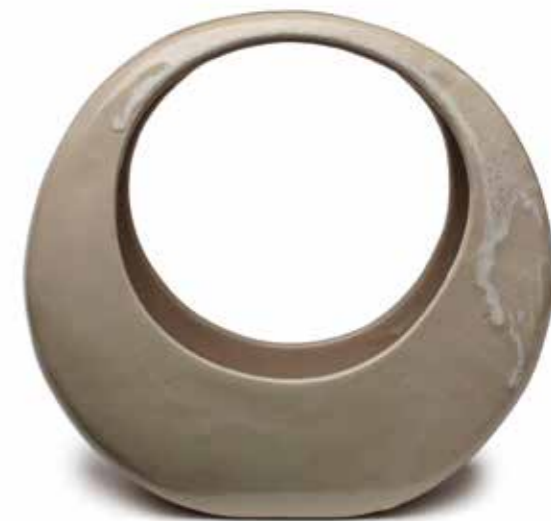
Schale »Sänfte« 29 x 10 x 10 cm Artikel Nr. 41 802