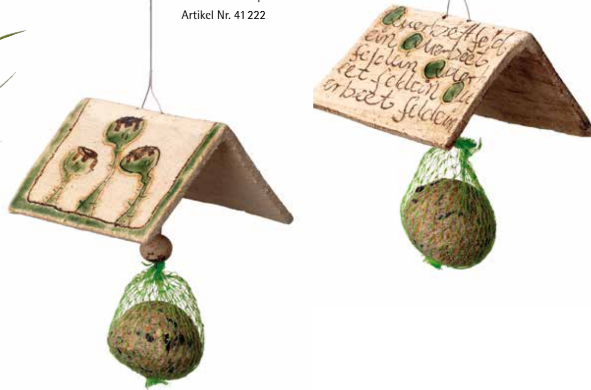
Vogelfutterdach Dekor »Querbeet feldein« Dekor »Mohnkapseln« Artikel Nr. 41 222