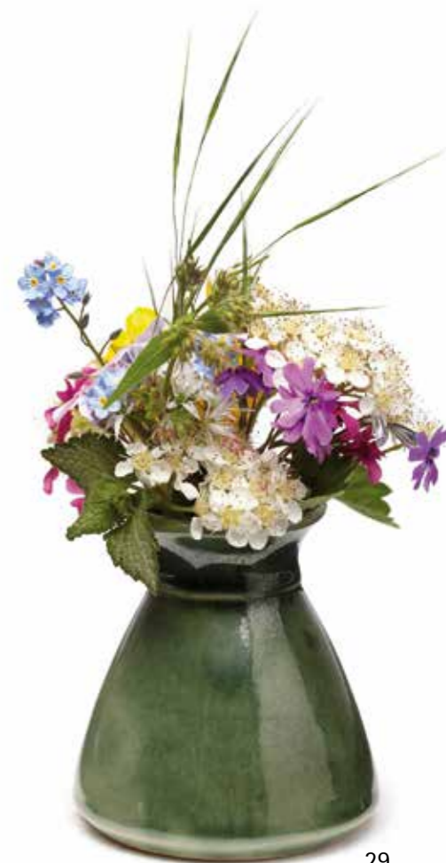
Vase, klein Höhe 8,5cm Artikel Nr. 41 163